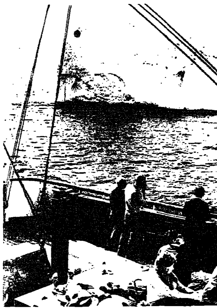
يواصل العلماء أبحاثهم بالقرب من جبال الجليد في مياه جرينلاند

يعلن مجلس المناقصات عن طرح مناقصة لإنشاء مساكن عمال البلدية - يمكن المتداولين من الدرجة الأولى والثانية فقط الحصول على مستندات الشروط والمواصفات من مكاتب وزارة الأشغال العامة في مسقط أثناء أوقات الدوام حتى ٧-٣-١٩٧٨ مقابل عشرين ريالا للسخة - يجب وضع العروض بصندوق المناقصات بمحافظة العاصمة مسقط - قبل الساعة العاشرة من صباح يوم الثلاثاء الموافق ١٤-٣-١٩٧٨ - رئيس مجلس المناقصات